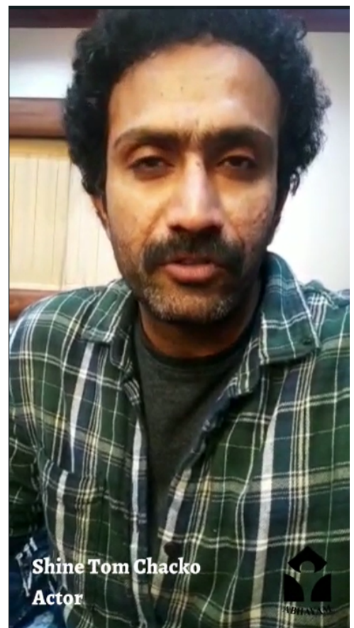
Shine Tom Chacko Actor

അഭയം ഭവന നിർമ്മാണ പദ്ധതി വിവരിക്കുന്ന പത്താമത്തെ പ്രമോഷൻ വീഡിയോ ഡിസംബർ ഒമ്പത്തിന് പുറത്തിറങ്ങി. വീഡിയോയിൽ അഭയം ഭവനനിർമ്മാണ പദ്ധതിയെക്കുറിച്ച് ഷൈൻ ടോം ചാക്കോ (ആക്ടർ )സംസാരിച്ചു. പദ്ധതിയ്ക്ക് ആശംസയും പിന്തുണയും അറിയിച്ചതിനൊപ്പം ഏവരുടേയും സഹകരണവും അഭ്യർത്ഥിച്ചു .