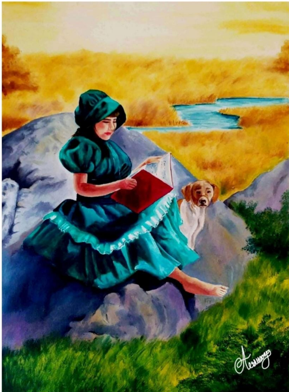
Aiswarya TP BSc Maths with physics